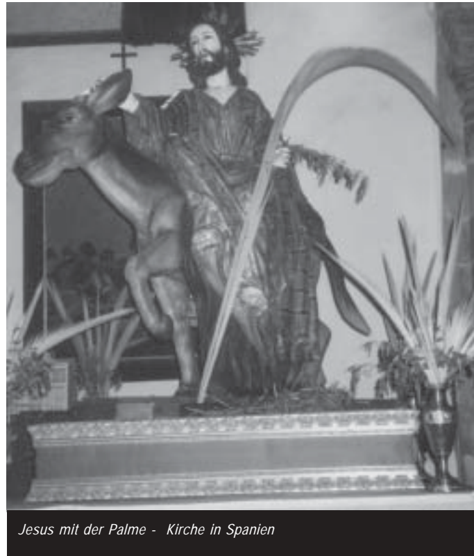
Jesus mit der Palme - Kirche in Spanien

gauer und Hans Baldung griffen diese Szene auf.