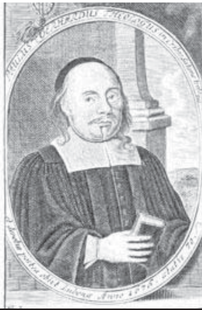
Der evangelische Liederdichter Paul Gerhardt

das Krankenbett geholt. Ich stelle mir vor, wie die Gärten in ihrer Zier, die Bäume voller Laub, die Glucke mit ihrem Völklein und die unverdrossene Bienenschar alle zumindest in Worten ins Krankenzimmer zu Besuch kommen und Paul Gerhardts Frau und auch ihn selbst trösten. Immer wieder hat sich Gerhardt auf diese Weise, in seinen Liedern, bei Gott bergen und aufgehoben fühlen können.