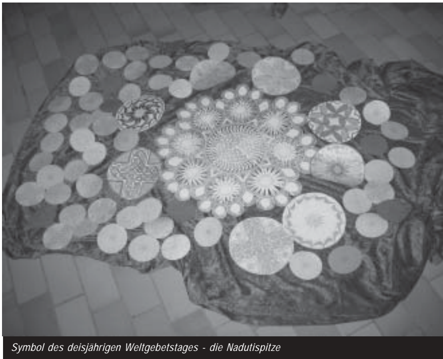
Symbol des diesjährigen Weltgebets-tages - die Nadutispitze

Ein Abbild der Nadutispitze, eine kunstvoll gewebte Stickerei, deren Mus-